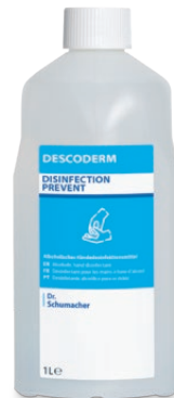
1 L Spenderflasche