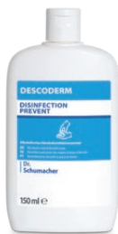
150 ml Kittelflasche