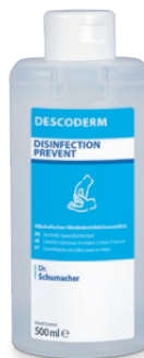
500 ml Spenderflasche