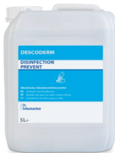
5 L Kanister

EBENFALLS UNERLÄSSLICH FÜR EINEN ERFOLGREICHEN INFektionSSCHUTZ: REINIGUNG, PFLEGE UND SCHUTZ. EMPFOHLENE PRODUKTE AUS UNSERER ABGESTIMMTEN DESCOLIND SERIE